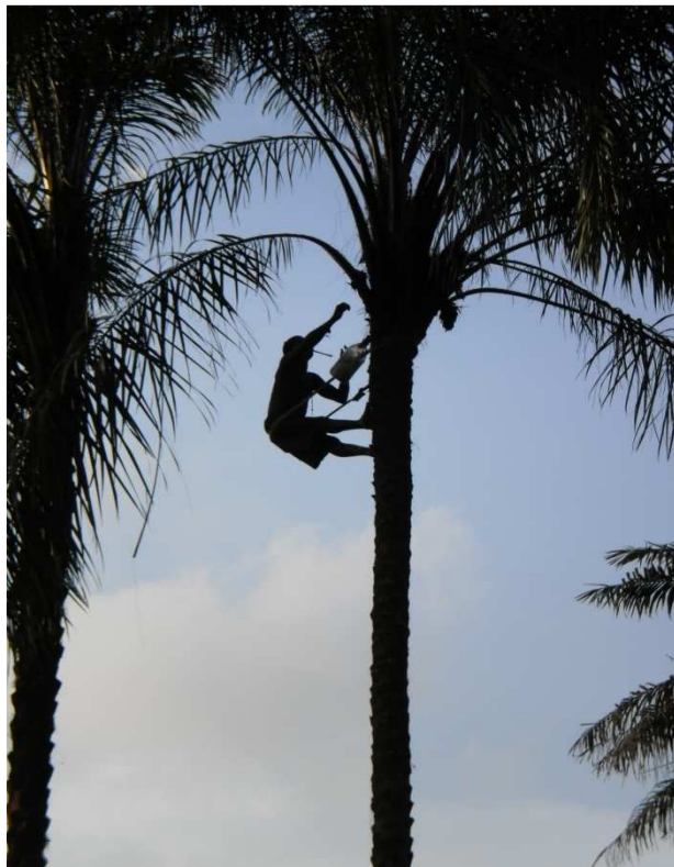
Tapper van palmwijn "de favoriete lokale drank "