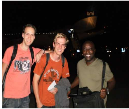
Aankomst by night airport Lungi

Daarnaast wonen de Sierra Leonezen in onze ogen in een zeer mooi en vruchtbaar land met prachtige bloemen, vlinders, vruchten, vogels en andere dieren. De wens van Koen, het zien van een echte kameleon, kwam zelfs na een paar dagen al uit ! Geweldig.