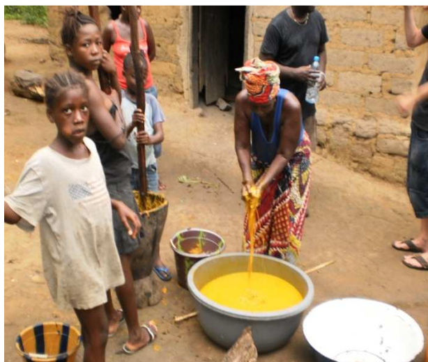
Verwerken van palmnoten tot palmolie