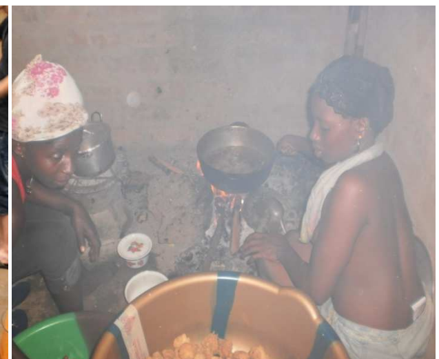
koekjes bakken in kookhutje voor het openingsfeest