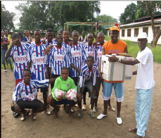
Friese shirts voor voetbalteam in Lunsar