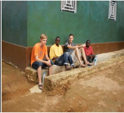
chillen met de "boys "