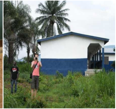
kijken bij de school